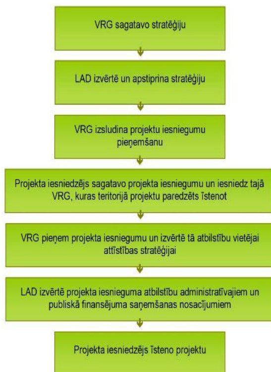
Attēls 3. LEADER pieejas projektu īstenošana

2006. gada 30. jūnijā tika nodibināta biedrība „Ludzas rajona partnerība”. Ludzas rajona partnerība ir biedrība, kurā uz brīvprātības un līdztiesības principiem ir apvienojušās juridiskās un fiziskās personas, kas atbalsta tās darbības mērķi un atzīst statūtus. Ludzas rajona partnerībai nav peļņas gūšanas nolūka un rakstura. Tā darbojas saskaņā ar LR spēkā esošo likumdošanu un statūtiem. Dibinātāji - Ludzas novadu pašvaldību, biedrību un uzņēmēju pārstāvji. Ludzas rajona partnerība pārstāv Ciblas, Ludzas, Kārsavas un Zilupes novadu (bijušā Ludzas rajona) teritoriju iedzīvotājus.