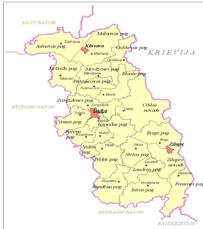
Attēls 2. Ludzas rajona partnerības darbības teritorija: Kārsavas, Ludzas, Ciblas un Zilupes novadi.

Ludzas novada kopējā teritorija aizņem 966 kv.km. Novada administratīvais centrs ir Ludzas pilsēta. Tā atrodas 267 km attālumā no valsts galvaspilsētas Rīgas, 122 km attālumā no Daugavpils un 30 km attālumā no Rēzeknes. Novada teritoriju šķērso valsts galvenais autoceļš A12 Jēkabpils – Rēzekne – Ludza – Krievijas robeža (Terehova), starptautiskās automaģistrāles E22 Rīga – Maskava daļa un dzelzceļa līnija Rīga – Maskava. Ludzas novada teritoriju veido 1 pilsēta - Ludza un 9 pagasti - Brigu, Cirmas, Isnaudas, Istras, Nirzas, Nūkšu, Pildas, Pūreņu un Rundēnu.