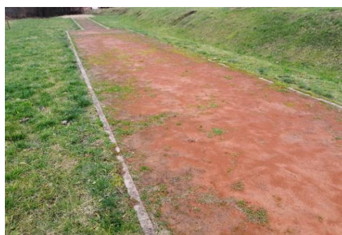
Pirmsprojekta fotofiksācija, 2019.gads.