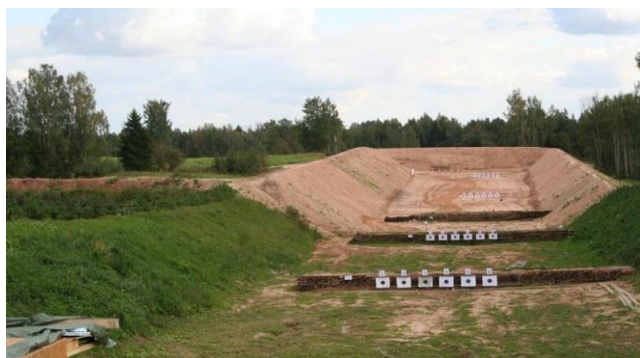
Bildei informatīvs raksturs