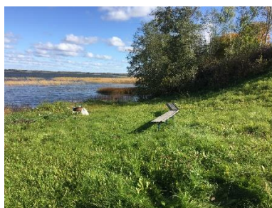
Atpūtas vieta "Pludmale" (kreisā puse)