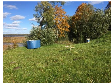
Atpūtas vieta "Pludmale" (labā puse)

Pirmsprojekta fotofiksācija, 2019.gada septembris.