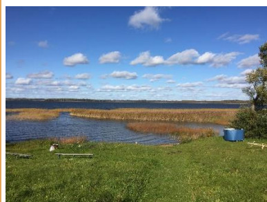
Atpūtas vietas "Pludmale" (kopskats).