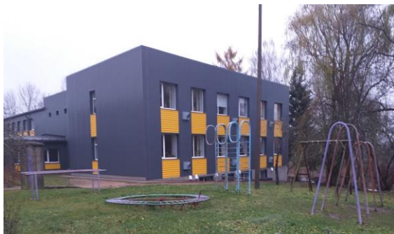
Esošais laukums pie Ludzas novada Pildas pamatskolas. 2019. gads.