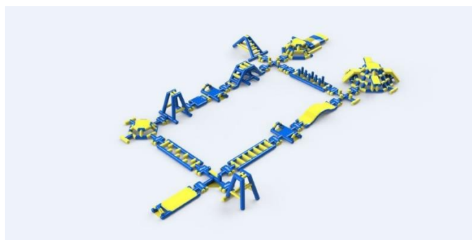
Bildei informatīvs raksturs