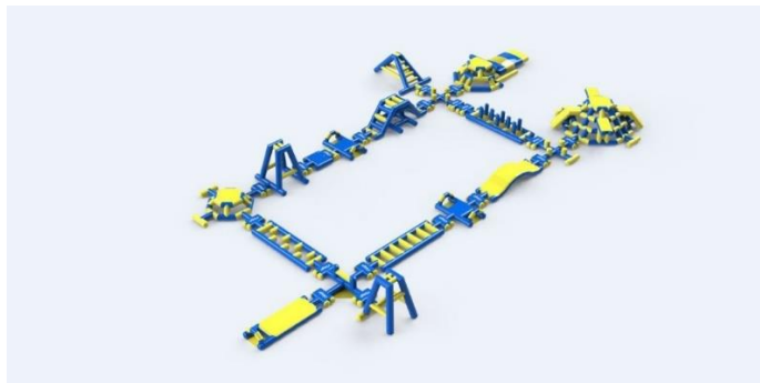
Bildei informatīvs raksturs