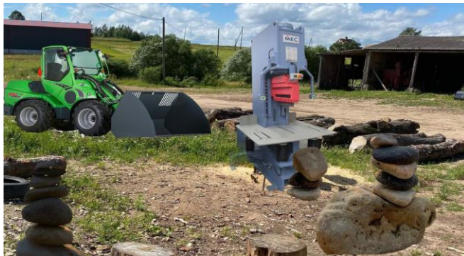
Bildei informatīvs raksturs