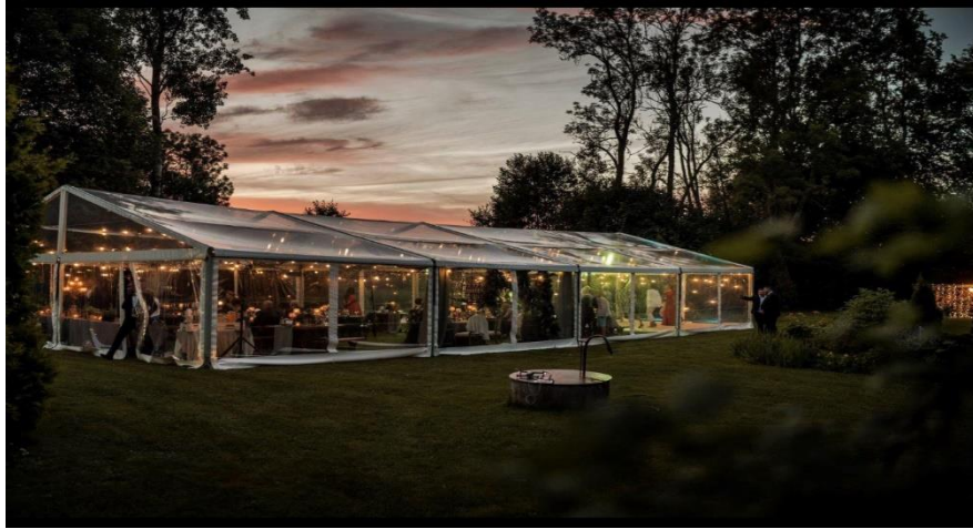
Bildei informatīvs raksturs